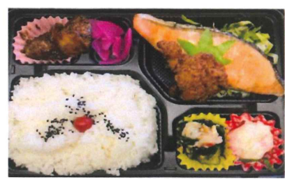
サケ OR 塩サバ弁当