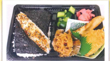
DXのり弁 OR おにぎり弁当