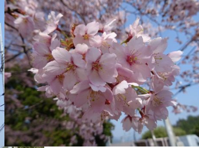
熊野市紀和町長尾地内