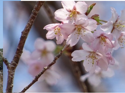
熊野市紀和町板屋地内