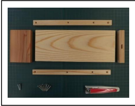
「シーソー型爪切り材料セット」