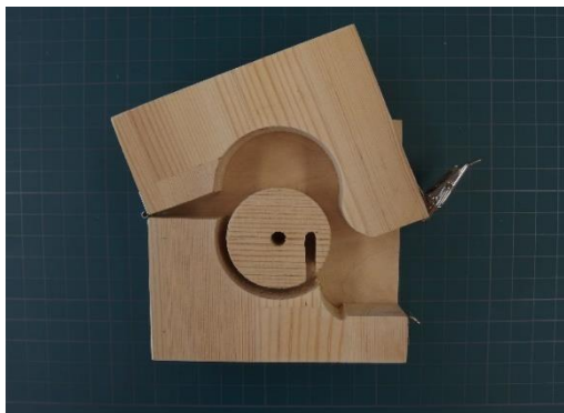
「ストローホルダー製作キット」の治具