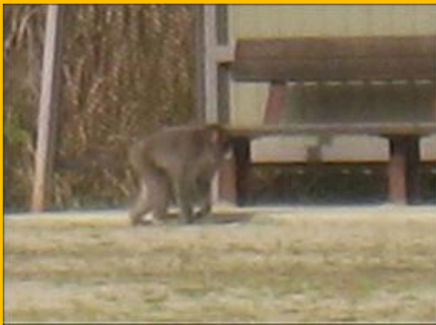
その後ろにも・・・