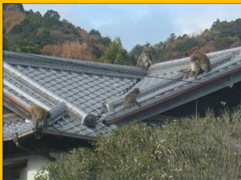
おサルの集会場。(笑)