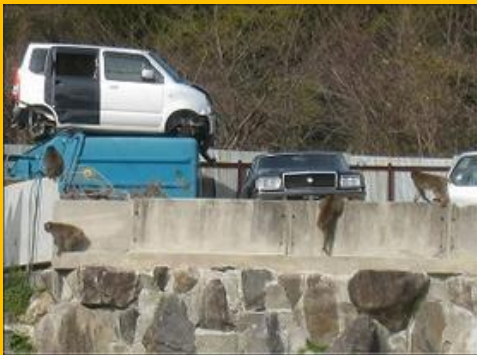
スクラップ置き場もこの通り・・・