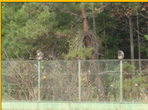
ネットの上に2匹！ 置物のように座っている！