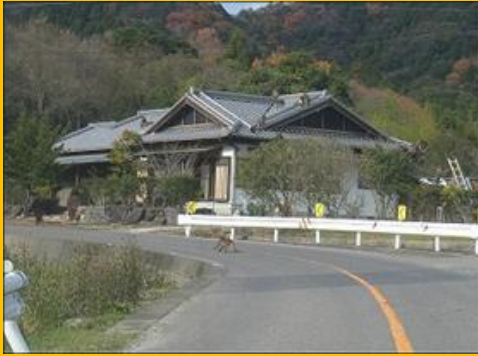
この隣の家は今日は住人がいないようです。