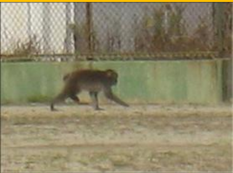
バックネット前にも！