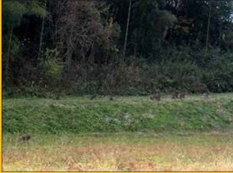
あぜ道が茶色く見えた！