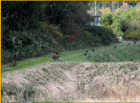
この隊列・・・なかなか見られません。(笑)