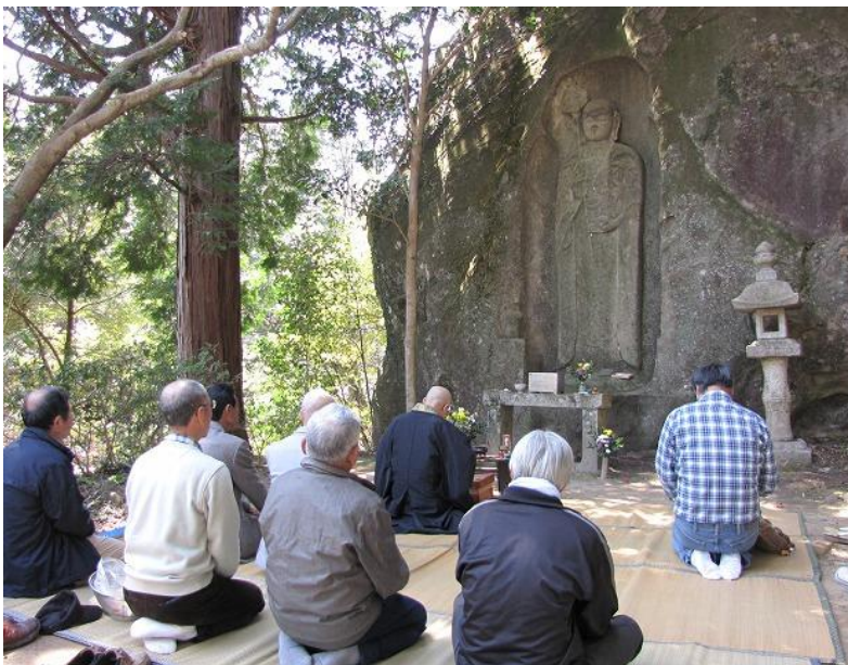
会式の模様（地蔵菩薩）