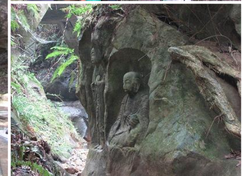
上：阿弥陀如来 下：橋下の地蔵