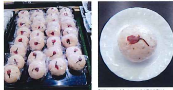
「松葉餅まんじゅう」は松葉餅に1個110円で販売。毎日約200個売れています。