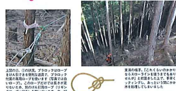
上図の1、2の位置、アトラロックロープを引手側から引くことで、アトラロックの位置がずれないようにします。アトラロックは、引手側のロープが滑り落ちてしまうのを防ぐために、引手側のロープを引手側から引くことで、アトラロックの位置がずれないようにします。