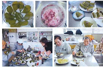
松葉餅の試作。会費があまり、暑中休暇、暑中休暇と松葉餅を売って収入を増やしたいと、松葉餅を作ってみようと思って。好評だった松葉餅が「松葉餅まんじゅう」として商品化されることになった。